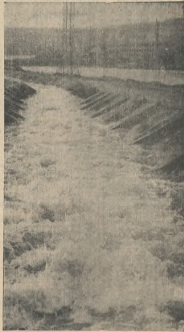
А весна — не за далью сизою, Убедись, оглянись, кто спорит, Что не только по телевизору, Что бурлит она и в Ковдоре!

И пусть фотоработы не равноценны по замыслу и исполнению, однако по ним можно судить о росте мастерства авторов.