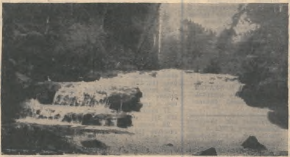
В истоках реки Канды.

Оболочку Земли, которая сформировалась под действием живого вещества, академик В. И. Вернадский считал биосферой. Всесторонне, глубоко рассмотрев идею биосферы, он открыл для мировой науки новый взгляд на деятельность человека, высказав яркую мысль о сфере разума, или ноосфере («ноос» — по-гречески «разум»). Статья «Несколько слов о ноосфере» была написана им в конце жизни, в 1944 году. Вернадский справедливо считал человека более могущественной геологической силой, чем биосфера. Овладев материальными и