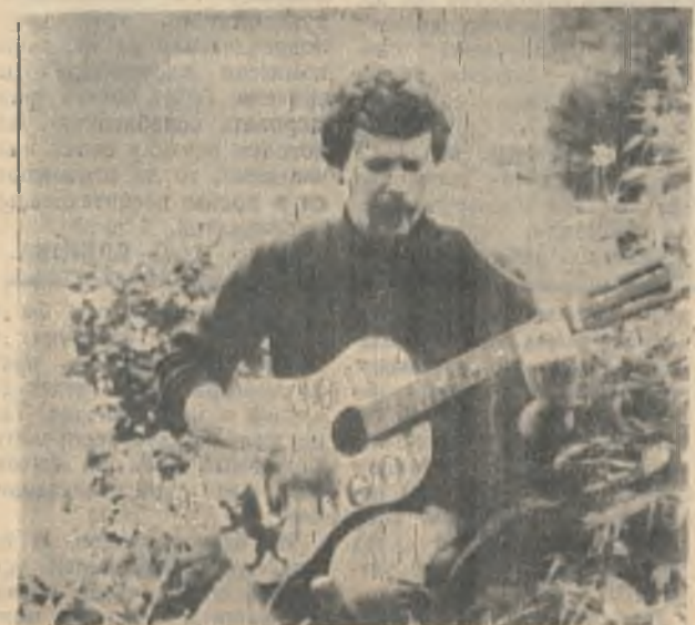
Звучали над озером песни под гитару, и хотелось, чтоб этот теплый вечер не кончался.