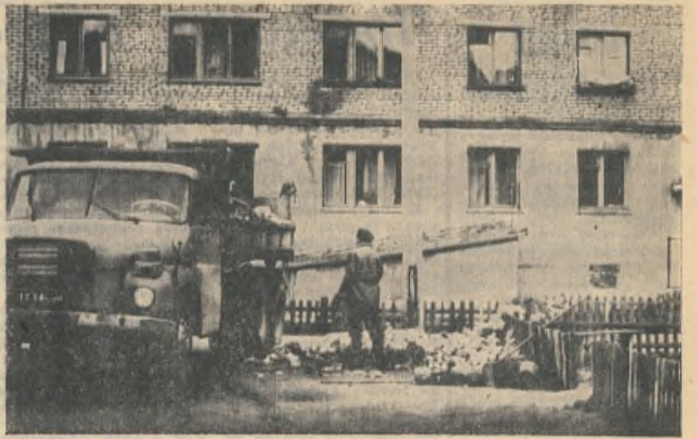
Идет месячник по благоустройству города. Где-то это чувствуется, а где-то — нет. Например, возле дома № 3 по улице Слюдяной. Груды мусора свалили не куда-нибудь — прямо на газон, словно это и не мусор, а удобрения. Словно никто из жильцов не знаком с графиком работы мусоровозки. Даже, если машины вообще нет (скажем, по выходным дням), все равно портить палисадник нежего.