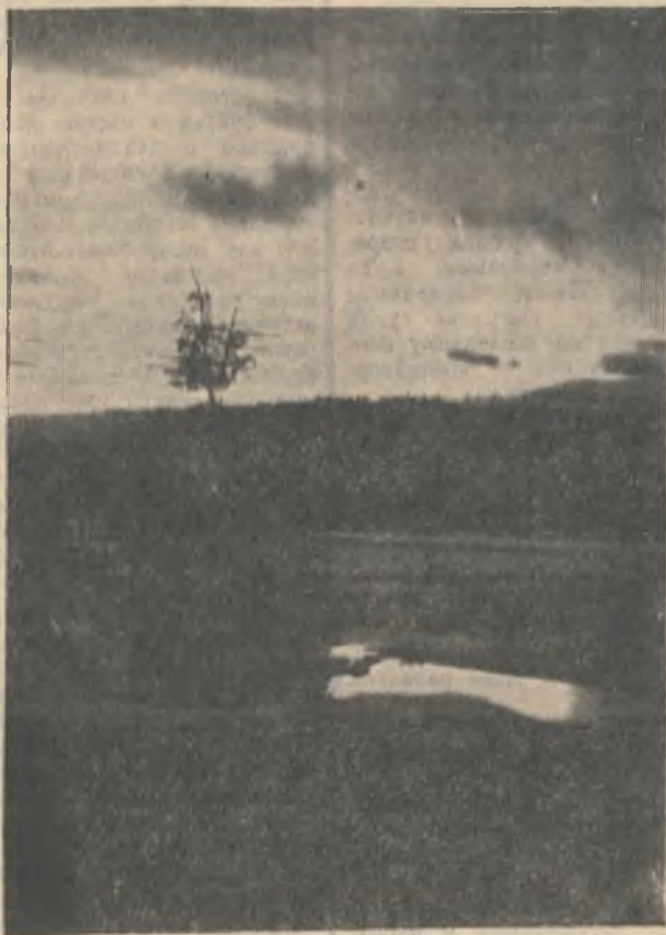
Радио снова сулит непогоду... А за окном горизонт полыхнет. Если полярное солнце мелькнет, Чтобы опять уйти на полгода — Как можно слушать сводку погоды, А не сбежать на прощальный восход! Фотоэтиюд О. Вишневой.