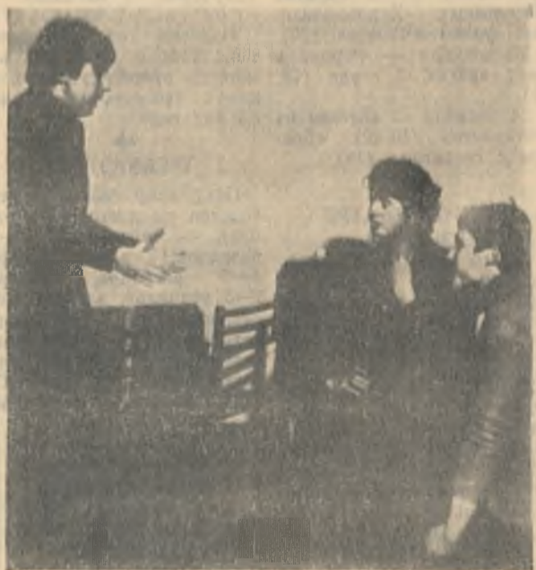
Новый спектакль готовит коллектив народного театра Дворца культуры по пьесе Льва Славина «Интервенция». Эту работу самодельные артисты посвящают 60-летию образования СССР. Полным ходом идут репетиции.

Примечание. В заметках использованы стихи Николая Рубцова. «Душа хранит» — название из прижизненных стихов поэта.