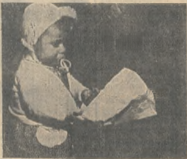
А что сегодня покажут «Для тех, кто не спит?»