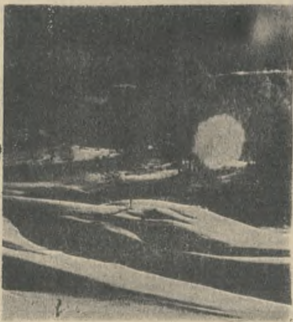
«Как ночь томительно длинна», — Вдыхаем тяжело и сонливо. Скучна, темна и холодна, Она и вовсе не нужна! ...Но все же сказочно красива!