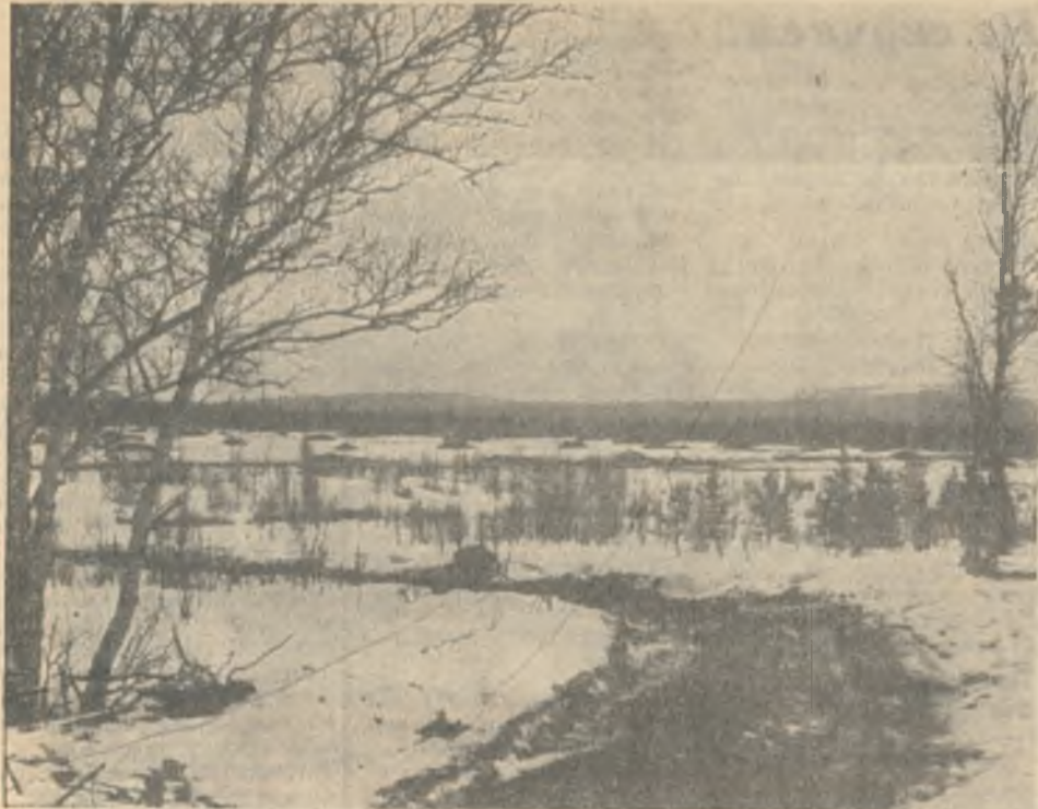
Еще не сошел снег, но по всем приметам видно: на поля подсобного хозяйства пришла весна.