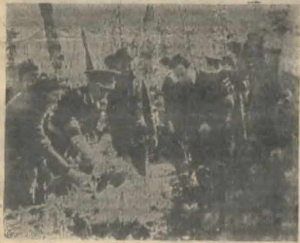
У братской могилы в Праздник Победы.