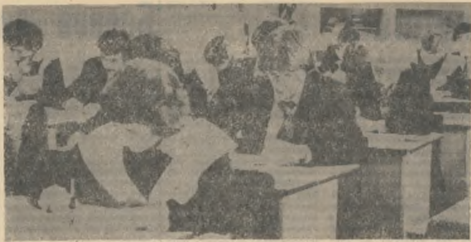
Идут экзамены... Ответственная пора: ведь надо показать все, чему научился за десять лет. А эта задача посложней алгебраической.