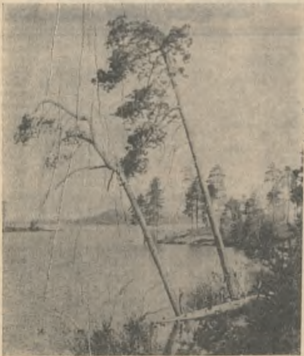
Под ударами ветра Не сдаются судьбе, Хоть колючие ветви Наклонили к воде.