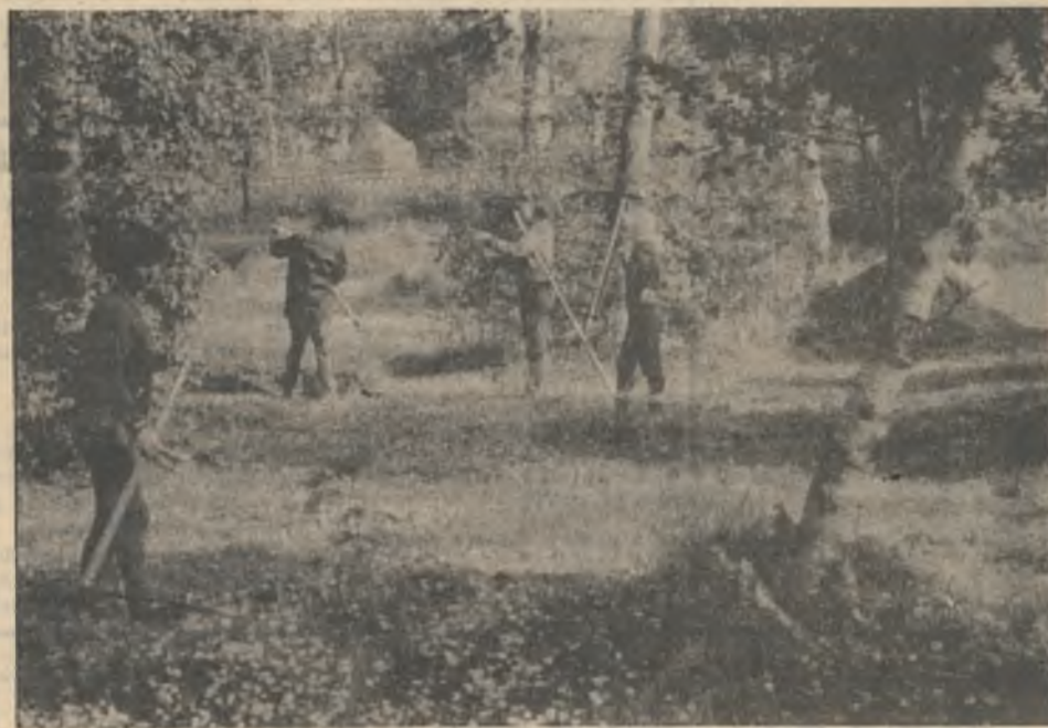
Активно включились в заготовку кормов для скота работники отдела технического контроля. За неделю они накосили и сдали 4 тонны лесного разнотравья.

Из подразделений Ковдорского ГОКа хорошо начали сдачу лесного разнотравья коллективы автотранспортного цеха, базы материально-технического снабжения, отдела технического контроля. Ни одного килограмма не накосили коллективы ремонтно-строительного цеха, цеха технологической диспетчеризации и связи, Дворца культуры, спорткомплекса и профилактория. Всего две тонны из 107 сдал коллектив цеха технологического транспорта.