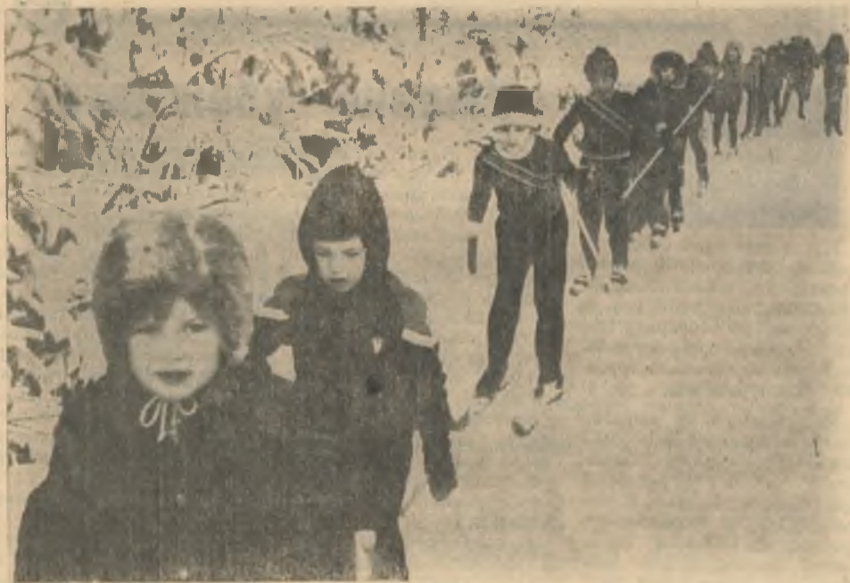
Длинная вереница в несколько сотен человек растянулась на освещенной трассе в день открытия конкурса «Лыжня зовет!». Дружно вышли на этот праздник юные спортсмены из школы № 1. Приятно сообщить, что наша подшефная школа названа в числе победителей на открытии массового лыжного сезона. Хороший пример для старших товарищей!