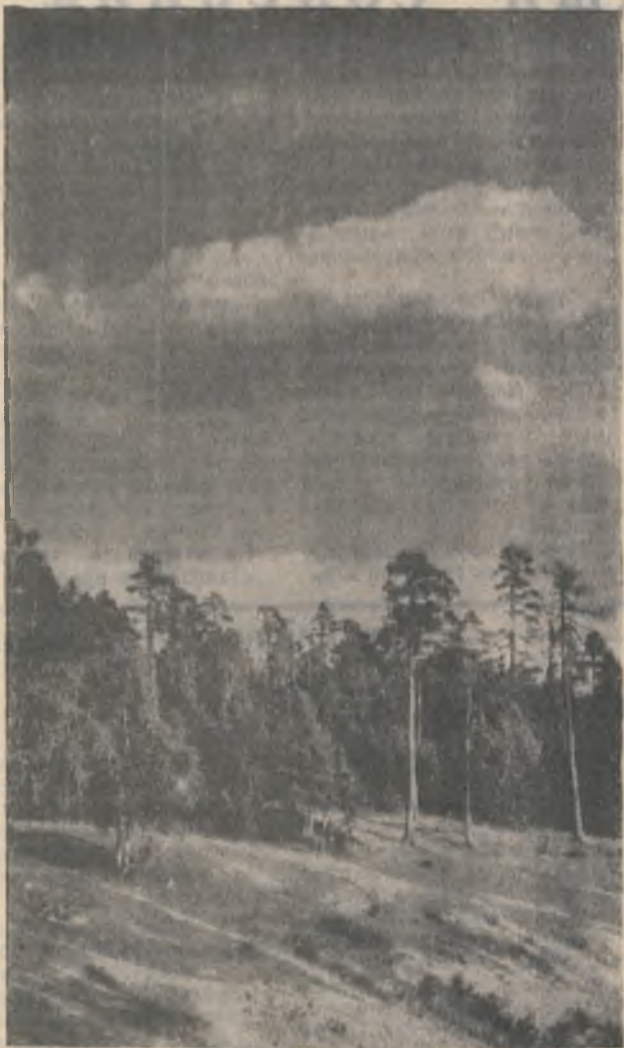
«Уж небо осенью дышало...».

Адрес редакции: 184140, г. Ковдор, ул. Парковая, 56. Телефоны: 72-751, 72-359. Индекс 52873 Тираж 4562. Ковдорская районная газета выходит один раз в неделю по пятницам.