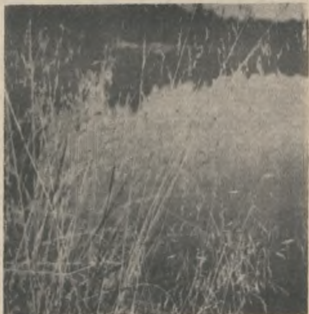
Прозрачен воздух, холодна вода, Травинки никнут — это осень вкратце. И никуда не деться, никуда От скорой перемены декораций.