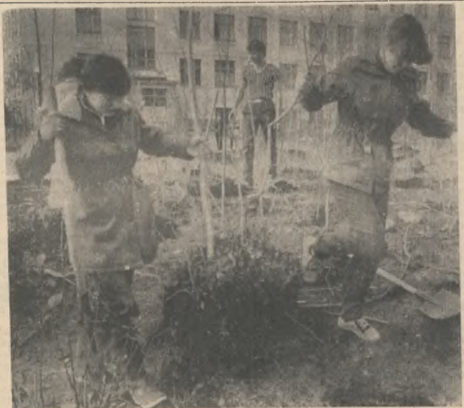
Активно включились в озеленение города учащиеся школы № 1. Будем надеяться, что после массовой посадки деревьев нынешней осенью Ковдор станет еще краше.

2. Разумное использование энергоресурсов в быту. (К. И. Иванов).