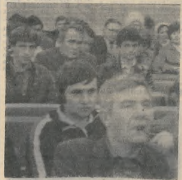
Внимательно слушают народные контролеры выступления своих товарищей.

Участники собрания одобрили положения и выводы, содержащиеся в речи товарища К. У. Черненко, о чем и вынесли постановление, в котором также намечена программа дальнейшей работы народных контролеров комбината.