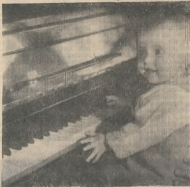
«Целый день, целый день, целый день заставляет тебя мама повторять, повторять, повторять: до, ре, ми, фа, соль, ля, си...»