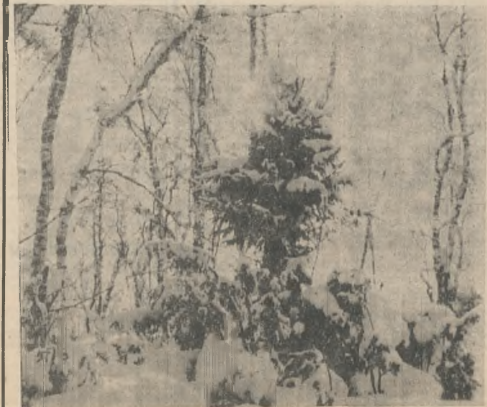
Хоть снег глубок, и злы морозы, но солнце говорит: «Весна близка».