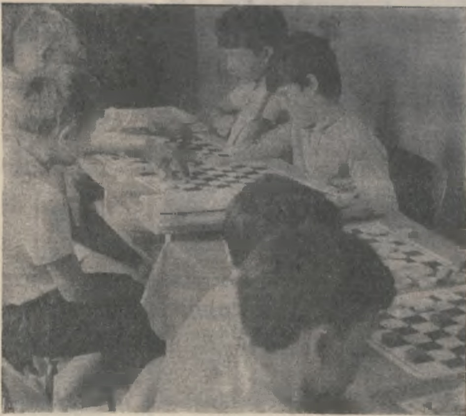
В напряженной борьбе проходил турнир «Чудо-шашки» в пионерском лагере «Ковдорец».