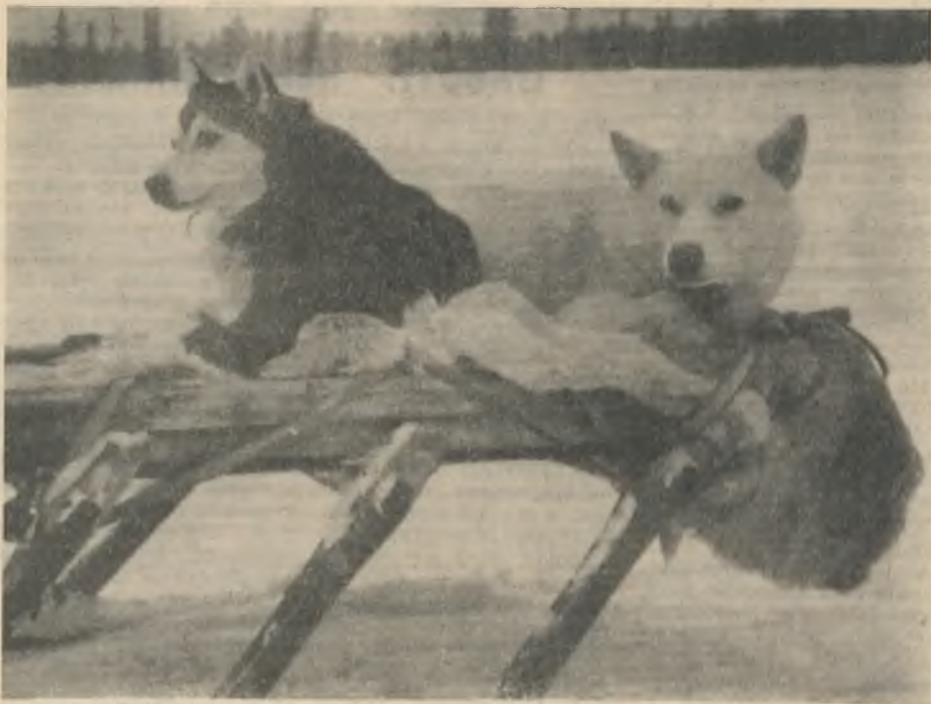
А говорят, что на Севере на собаках ездят...