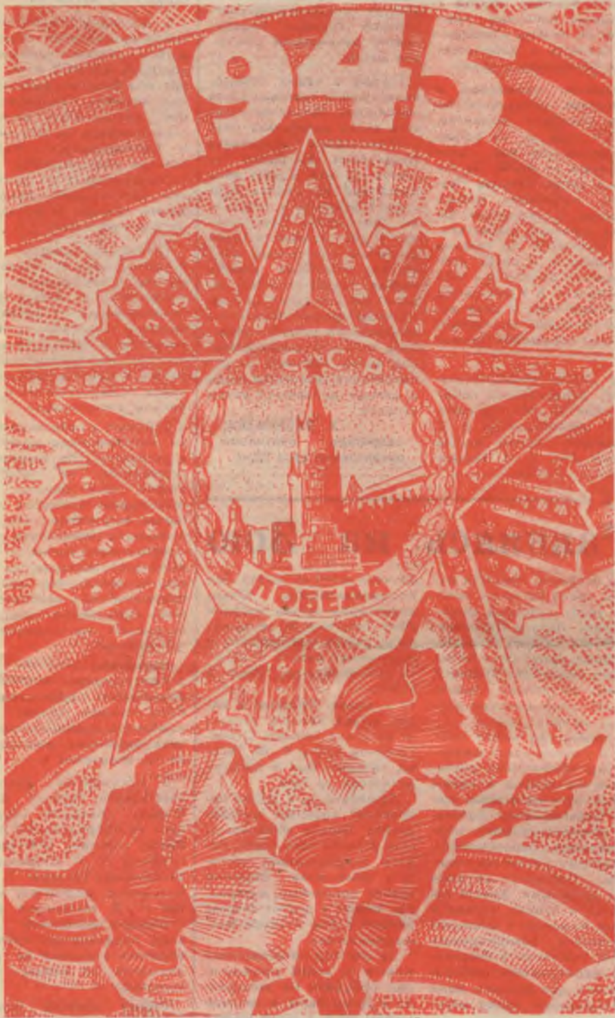
Рисунок Г. Гуськова.