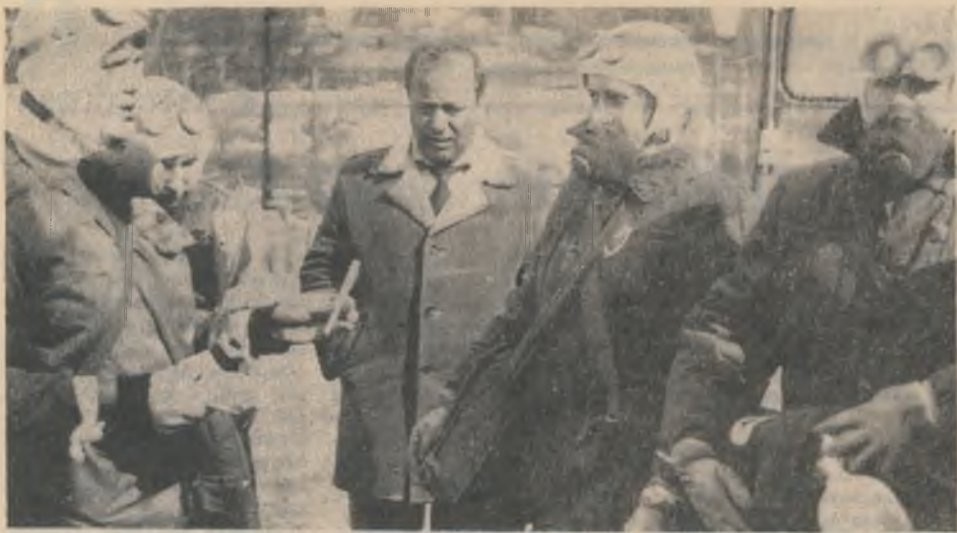
В районных соревнованиях сандружин выступили представители ведущих предприятий. Ковдорский ГОК по просьбе организаторов выставил две санитарные дружины. Участники продемонстрировали знания, умения и навыки по курсу гражданской обороны.