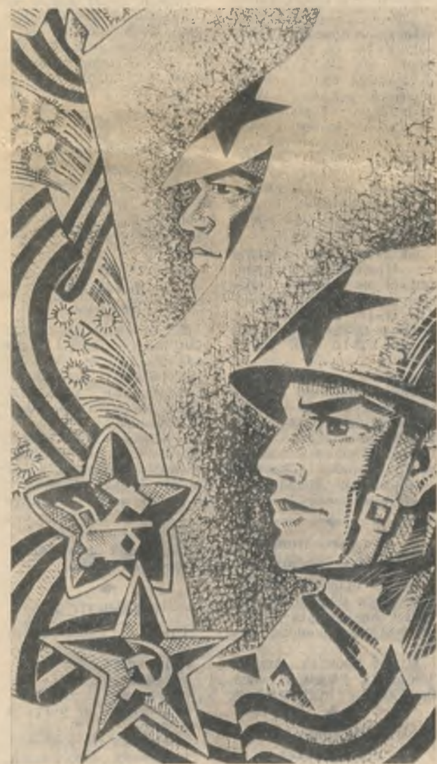
Рисунок Г. Гуськова.