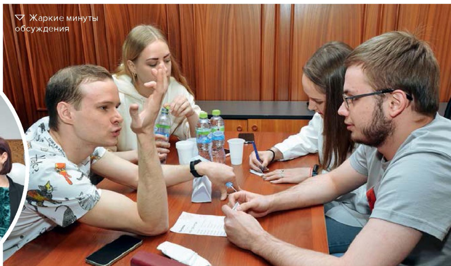
▽ Жаркие минуты обсуждения