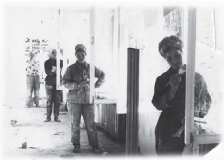
Будни бригады маляров

Известно, что нелегко руководить коллективом в 30-50 мужчин. Но куда сложнее, если под твоим началом женщины. Тут и характеры «потоньше», и нервы более чувствительные, и психология другая. Здесь не крикнешь. Одни уговоры да убеждения тоже не помогут. Нужно «подобрать ключик», нужно завоевать авторитет да такой, чтобы несколько десятков «слабых сердец» поверили тебе, поняли тебя. У самого же бригадира нервы должны быть «железные»,