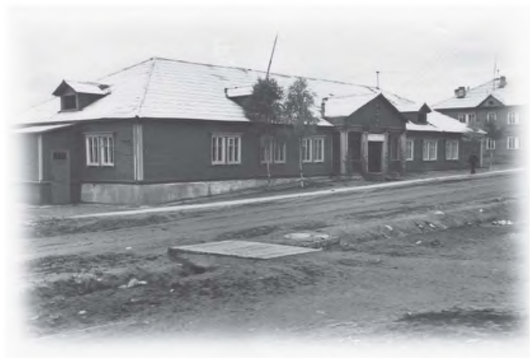
Бывшая больница в п. Ковдор (классический барак серии К-7)

Застройка посёлка временными деревянными домами барачного типа (К-7) планировалась для поселения в них строителей и ограничивалась нынешними улицами: Горняков - Парковая - Строителей - Победы. В дальнейшем возникла необходимость расширения временного посёлка до улицы Новой. Кроме домов барачного типа с Петрозаводского завода домостроения потом начали поступать комплекты деталей 2-этажного дома (К-9), которые сейчас стоят рядами в этой части города.