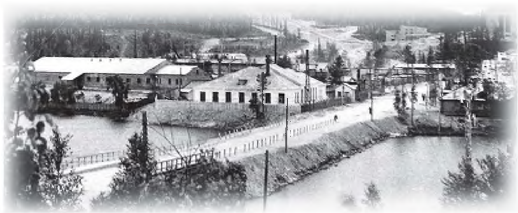
Дамба через озеро Ковдоро. Конец 1960-х гг.

Долго «не хотели» нормально садиться на дно ряжи, валились на бок. И так далее, и так далее.