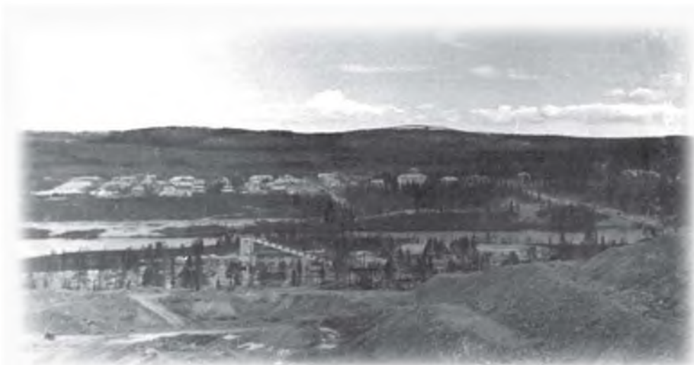
Посёлок Ковдор. 1957-1958 гг.