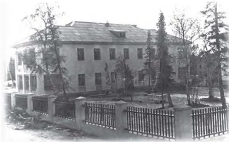
Детские ясли «Малыш» (позже - музыкальная школа, в настоящее время - ДШИ)

Больница, продовольственный магазин, клуб находились