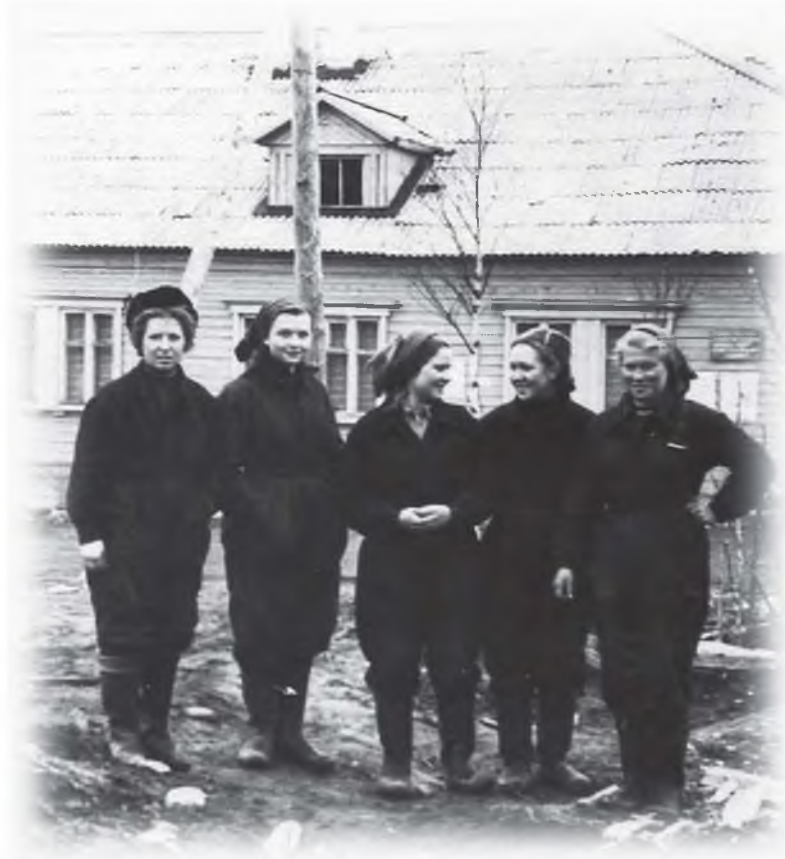
У столовой по ул. Горняков