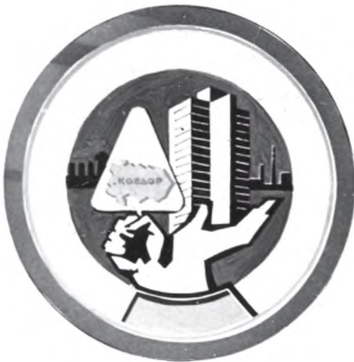
Логотип треста «Ковдорстрой»