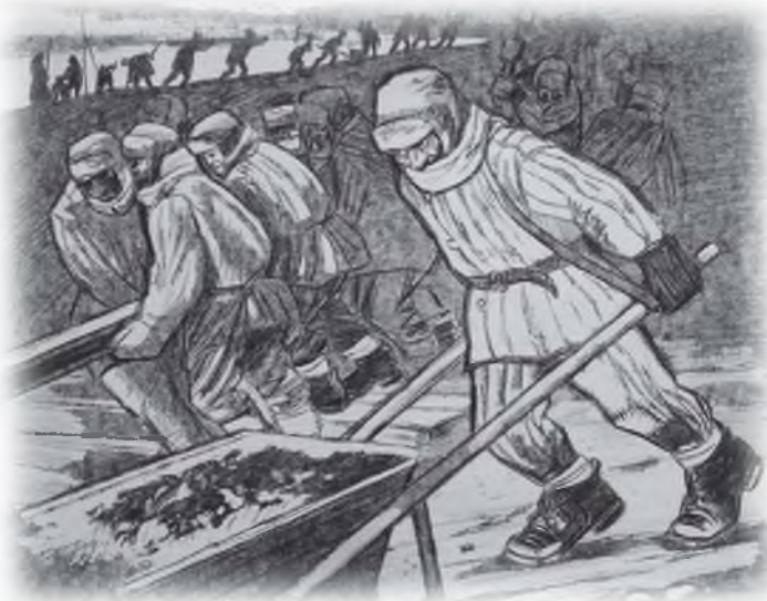
Строительство железной дороги Котлас - Воркута