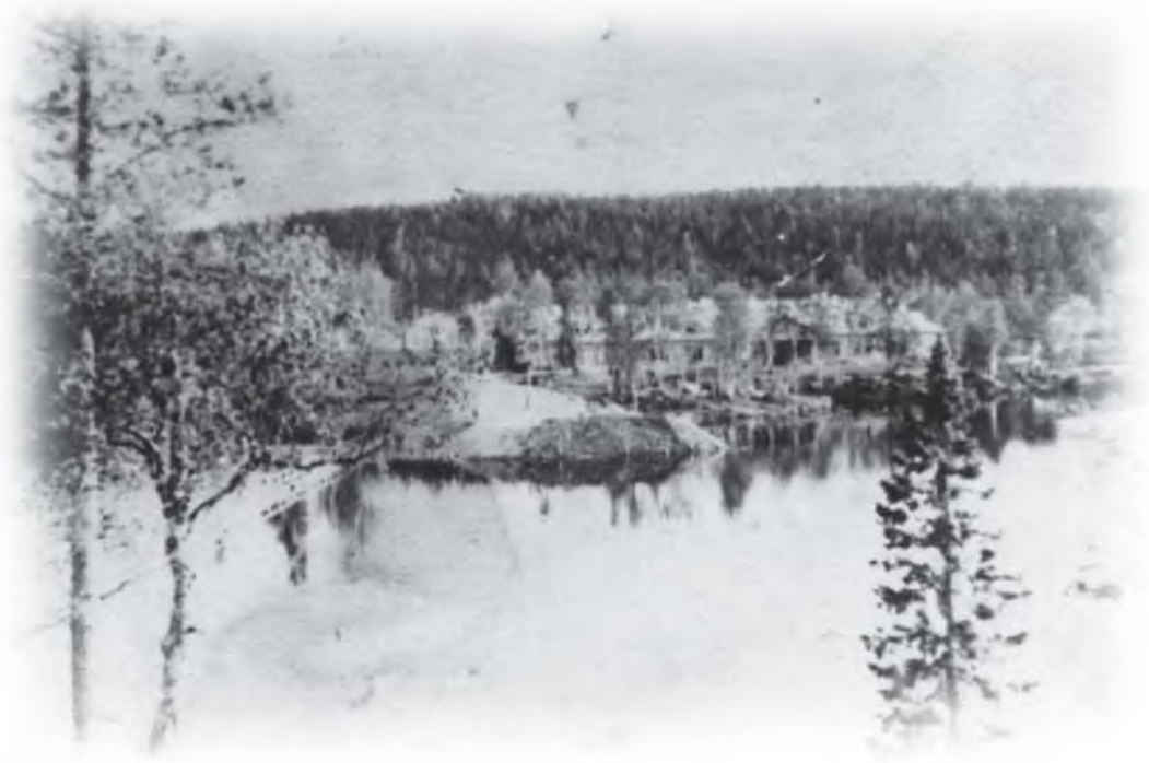
Первые бараки Старого Ковдора. 117 км.

Параллельно на будущей промплощадке (там сейчас находятся управления ОРСа, УПТК и КПП) строились четыре сборных каркасно-засыпных дома (барака), которые поставлялись готовыми деталями с Петрозаводского завода домостроения. Сборка этих домов производилась быстро и не требовала рабочих высокой квалификации. Достаточно иметь в бригаде из 15 человек 3 - 4 квалифицированных плотника.