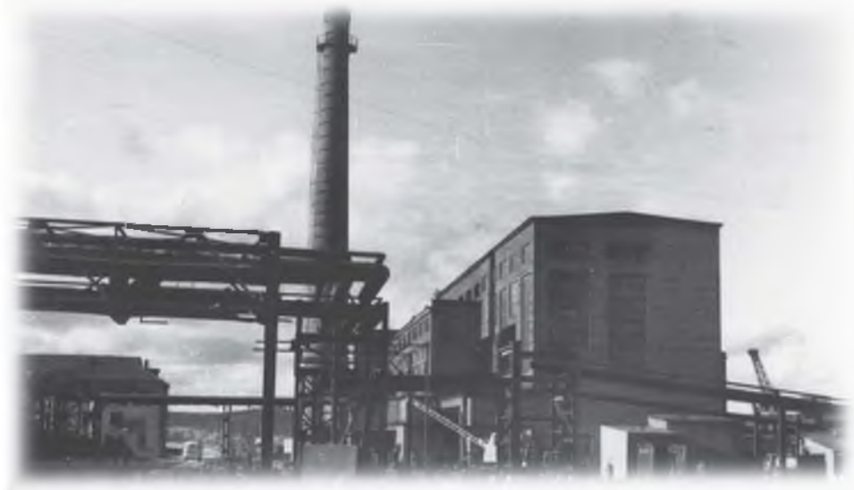
Важный строительный объект - обогатительный комплекс КГОКа

В августе были закончены строительные и монтажные работы на галереях №№ 10-14, перегрузочном узле № 2, многие этапы в корпусе обогащения, на насосной хвостового хозяйства, производственного водоснабжения, футеровались два котла ТЭЦ, без которых немислима была работа комплекса с наступлением зимы.