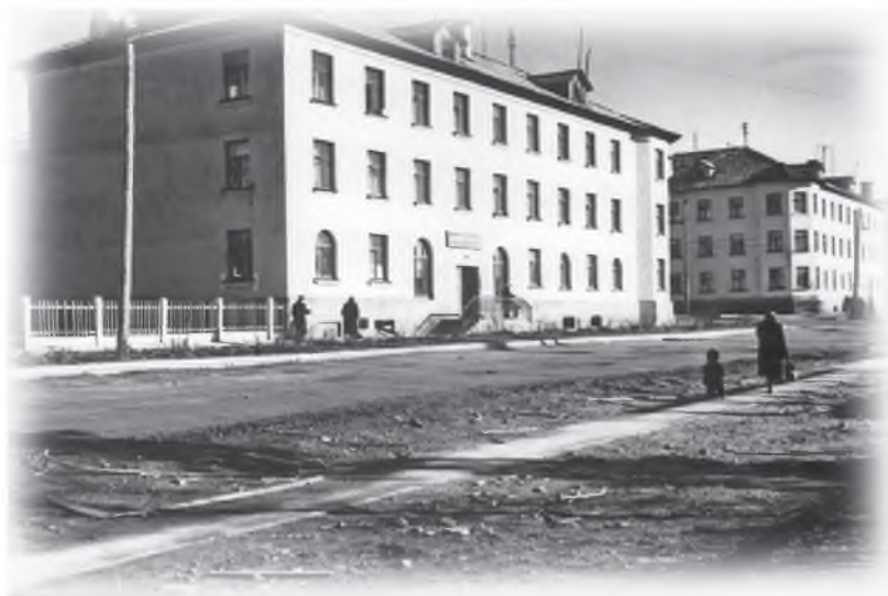
Улица Парковая, дом № 17

В те годы кирпича не хватало, его завозили даже из Новгорода. А строить нужно было, и нам говорили: думайте на месте, как выходить из положения, а план выполняйте, и чтоб никакого там нытья. И мы думали. А выход был, как уже потом казалось, не такой уж и сложный. Но это было потом, а вначале у руководителей голова трещала и ночами не спалось.