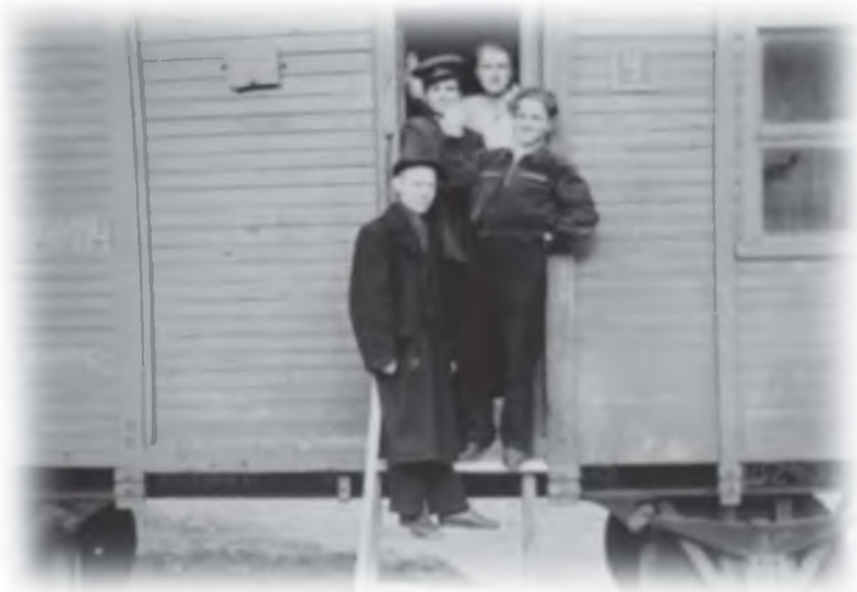
Жилой вагончик в Куропте. 1951 г.