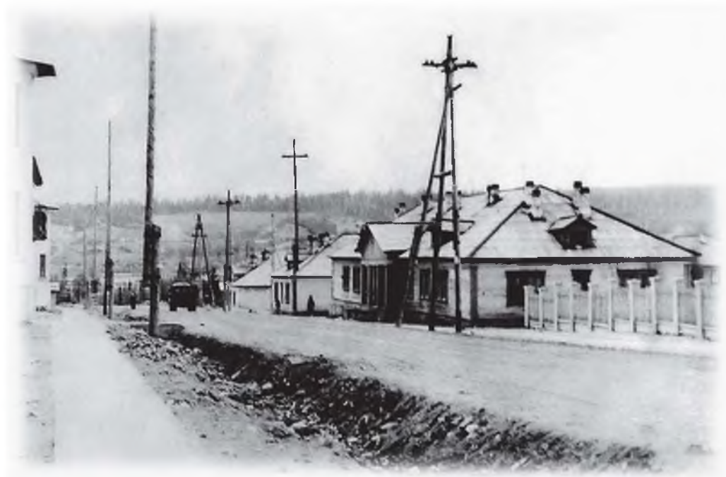
Улица Горняков. 1960-е гг.

А судьба его, как и бывшего детского садика, тоже необыкновенная. Построен он был, как и другие бараки, под жильё. Потом, после перевода из Старого Ковдора, в нём размещалась школа, затем милиция, хозяйственный магазин, управление рудника «Ковдор». Несколько лет этот барак пустовал, и снова теперь там жильё, но уже благоустроенное, для работников РСП (и такая организация теперь в Ковдоре есть).