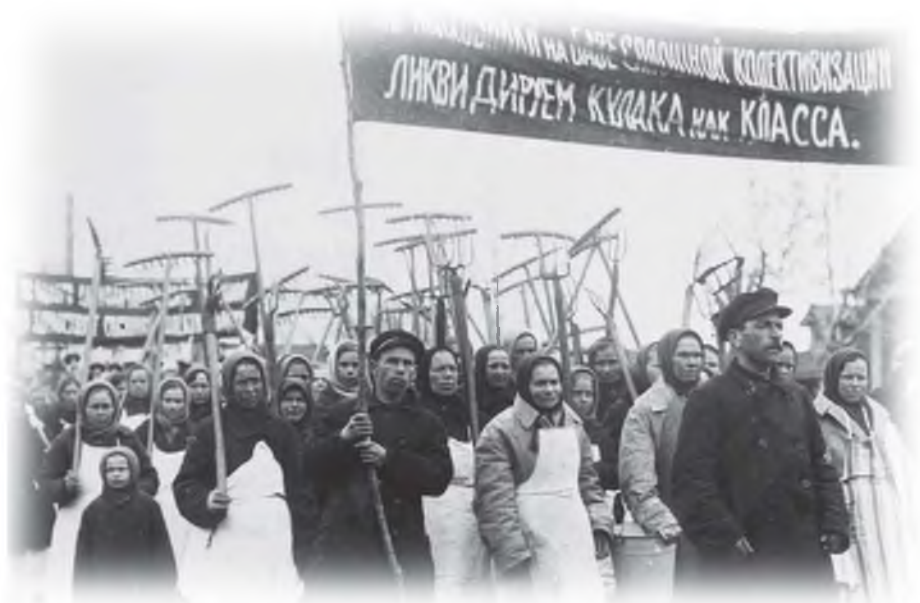
Призывы к сплошной коллективизации

Вскоре вся семья объявляется кулацкой и облагается непосильным налогом. А так как стоимости имущества, оставшегося к тому времени не хватало на покрытие налога, то всё описывается, забирается, продаётся, а семья принудительно высылается из дома. Мы переезжали к сестре моей мачехи (отец, мачеха, я, младший брат и две маленькие сестрёнки) в соседнюю деревню. Никаких средств к существованию. Мачеха с детьми остаётся, а мы с отцом идём на заработки, мне тринадцать лет. Целые дни работаем поперечной пилой на лесоразработках. Конечно же, отец оберегал мои силёнки, таскал пилу практически один. Вскоре он тяжело заболел. Мы вынуждены были вернуться к семье. Через два дня я снова ушёл в надежде где-то устроиться. На дворе был 1932 год.