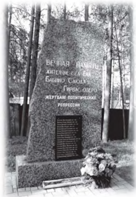
Памятник жертвам политических репрессий в селе Ёна. Установлен в 2013 г.

Нужно ли знать историю своей малой родины — это уже не риторический вопрос. Необходимо! Достаточно вокруг примеров, к чему ведет беспомыслие, нахальная уверенность в том, что до нас был потоп и ничего другого.