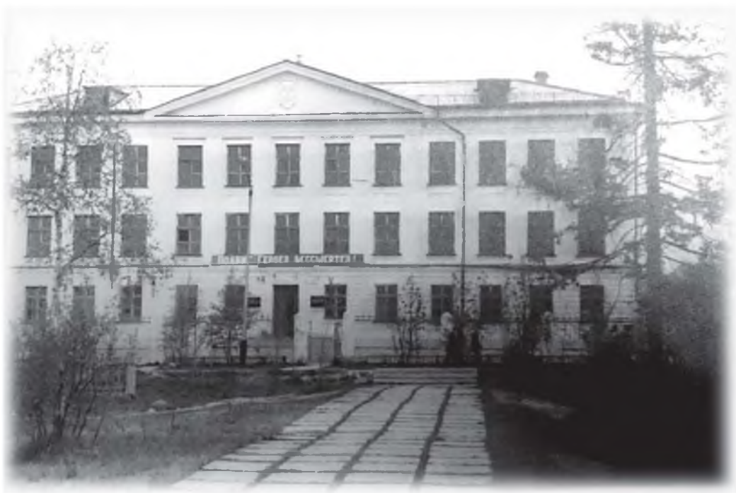
Школа № 16

В 1957 году на теперешней улице Горняков был построен и заселён первый двухэтажный каменный дом. Я уже раньше говорил, что 1 сентября 1956 года открылись двери первой каменной трёхэтажной школы в Ковдоре, ныне школы № 16. Но первый учебный год занятия шли только на третьем этаже, на остальных ещё всю хозяйничали строители. А к началу 1957-58 гг. учебного года школа была полностью достроена и введена в эксплуатацию.