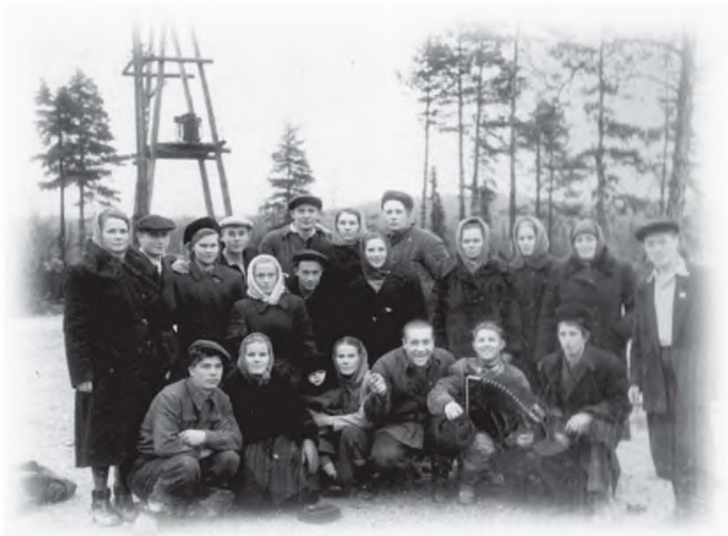
Молодые строители Ковдора. 1955 г.

Е. Ивановой и другие, уже были сформировавшиеся, крепкие, работоспособные коллективы. Уже работали участники субподрядных организаций: «Лен-электросетьстроя», «Электромонтажа», «Сантехмонтажа», «Союзэкскавации», «Трансводстроя».