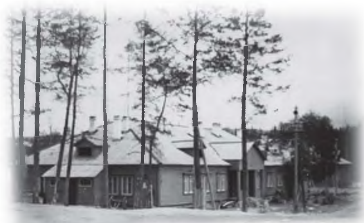
Улица Ленина. 117 км. 1954 г.

В таком здании, которых и сейчас в Ковдоре немало, - 16 комнат по 20 и четыре по 9 квадратных метра. В бараке можно было разместить и общежитие на 80 человек, либо поселить 20 семей. По нормам того времени. Для ускорения сборки барачков привлекалась субподрядная организация «Индустрой».