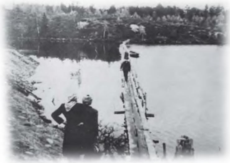
Переход через озеро Ковдоре

Одновременно управление строило бетонно-растворный узел, карьеры песка и гравия, складские помещения, конюшню, пилораму. Подошли механизмы,