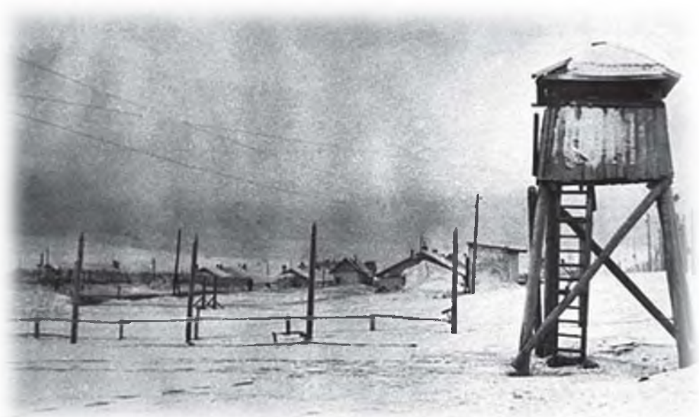
Сторожевая лагерная вышка