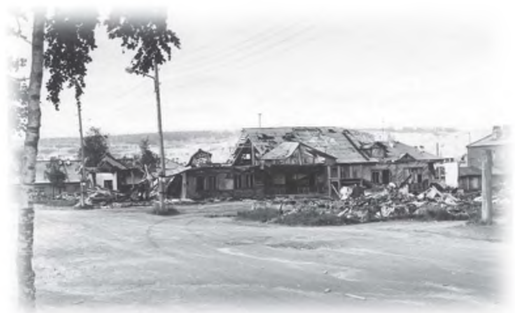
Начали рушить бараки

И ещё один вопрос. Символично, в год первого юбилея нашего города идет интенсивный снос бараков - то, с чего мы начинали двадцать пять лет тому назад и что сегодня уже изжило себя. Что уходит в прошлое, уходит безвозвратно в масштабе всей страны. Это ещё один важный фактор в истории нашей Родины, в завоевании советского народа - страна без бараков.