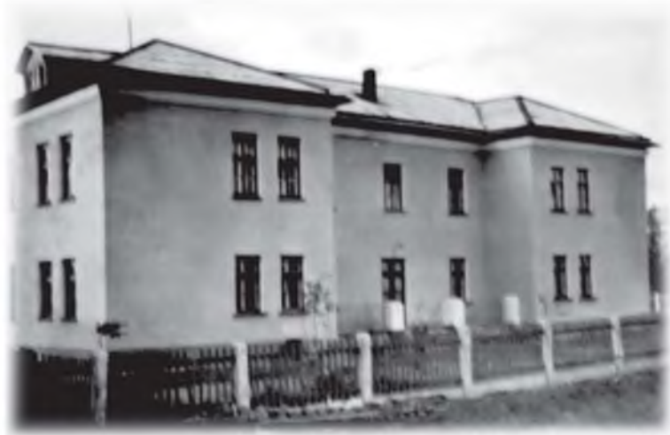
Детский сад «Берёзка». 1959 г.