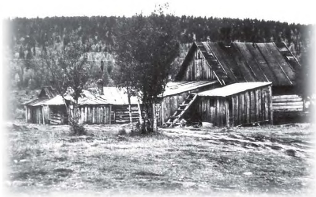
«Жильё на Старом Ковдоре»

школа, баня. На промплощадке достраивались четыре дома-барака, каждый по 20 комнат. Действовали, хоть и временные, растворный и бетонный узлы. Уже были небольшие и строились ещё мастерские для службы механизации, гараж и т. д.