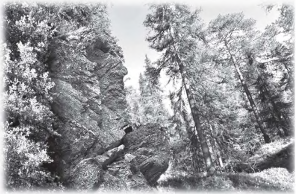
Скала «Голова воина» в Рубиновом каньоне

За мостом идёшь по петляющей всё выше и выше дороги, которую и доро- гой-то нельзя назвать, а так, когда-то наезженная тракторами, размытая, в кол- добинах колея. А подъём всё круче и круче. Склон северный, поросший ельни- ком, и сплошь ягодник. Но ягоды здесь бывают в жаркое лето. Тут солнца мало. И вдруг: что за диво! Из земли крона сосны с ветками, а ствола нет. И так одна, другая, третья. Метрах в двадцати.