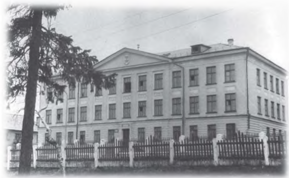
Ограждение возле школы № 16

Кстати сказать, в тех условиях само здание школы, начиная с нуля и включая основные отделочные работы, было построено за 9 месяцев. Да плюс ещё благоустройство территории. И с грустью приходится сегодня смотреть на то, что осталось от зелёных насаждений.