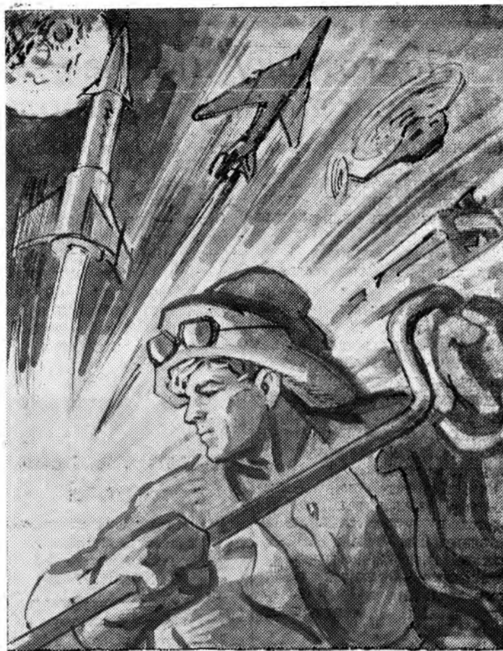
Плакат художника В. Жарнинова.