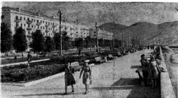
НОВОРОССИЙСК. Городская набережная.

24 сентября исполняется 125 лет городу Новороссийску